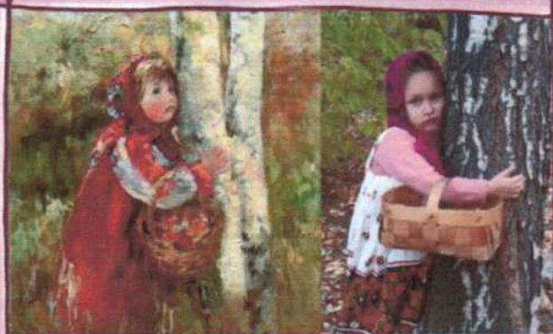
И. Морозова «Девочка с лукошком»