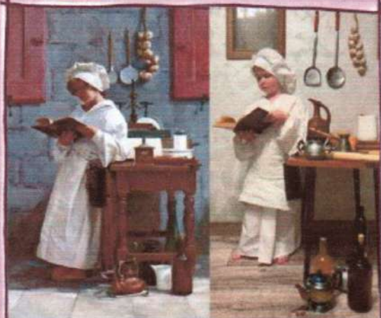
М. Денисов «Поварёнок»