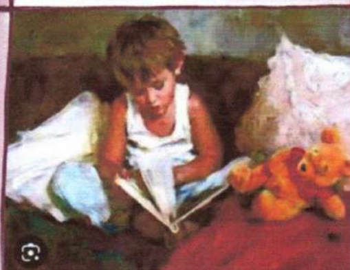
М. Гармаш «Мальчик с книгой в руках»