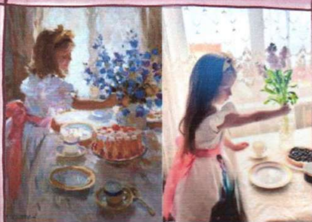
Ю. Кротов «Хозяйка»