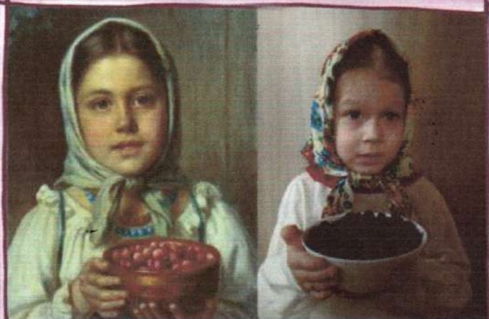
Н. Ручков «Девочка с ягодами»