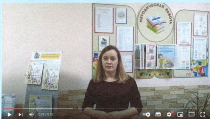
ДОУ 352_Организация методической работы в дистанционном режиме

Я в своей профессии....художник, дизайнер и маляр, сценарист, режиссёр и ведущий, садовник, программист, психолог....думаю этот список можно продолжить... А на самом деле – специалист методической службы детского сада, педагог и наставник.